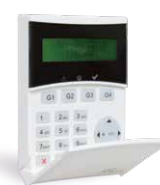
K-Lcd Light K-Lcd Light Plus Teclado LCD compacto