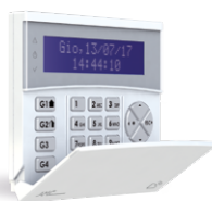
K-Lcd Blue Tag Teclado LCD con lectores RFID/NFC